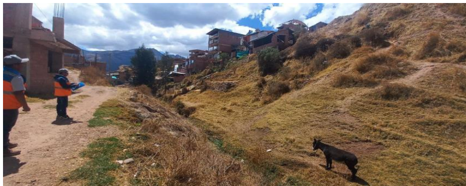
FIGURA N°01: TRAMO DONDE SE REALIZARÁ LOS TRABAJOS DE DESCOLMATACIÓN DE LA QUEBRADA HUANACAURE.