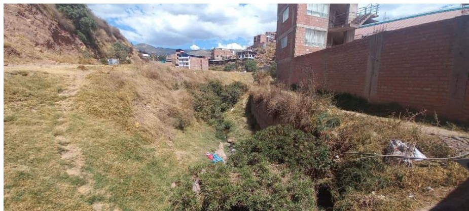
FIGURA N°02: TRAMO CRÍTICO EN LA QUEBRADA PURGATORIO, DISTRITO DE SAN JERONIMO, PROVINCIA DE CUSCO - CUSCO, SE APRECIA EL CAUCE COLMATADO.